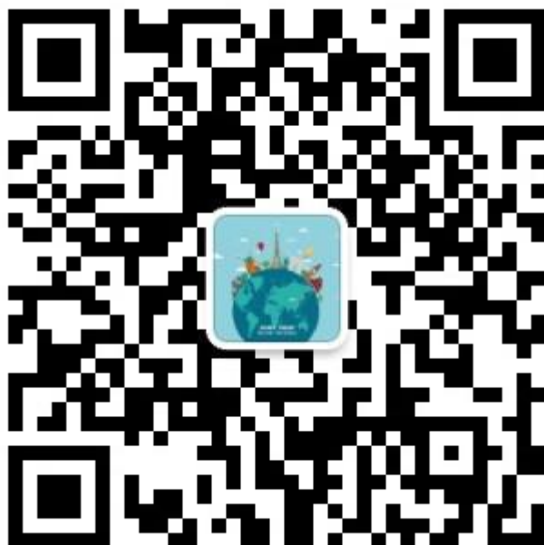
耿丹与世界微信公众号